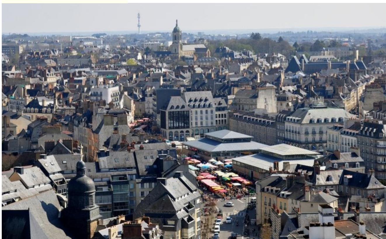
Place des Lices - Rennes