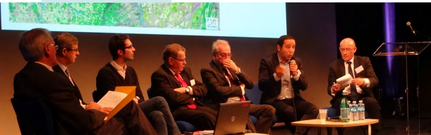
Intervention de la délégation lyonnaise le 2 décembre 2015

Les réflexions ont été amorcées sur la question des indicateurs de suivi de l'InterSCoT. Un premier recensement d'indicateurs propres à chaque SCoT a été engagé.