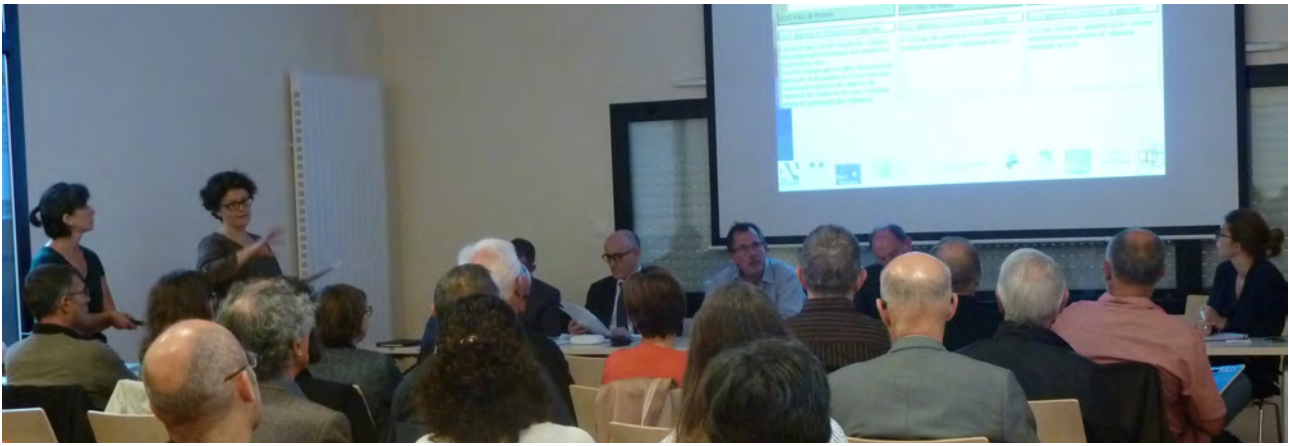
Ateliers ZA - Porter une réflexion sur l'implantation des activités économiques et la reconversion des friches - Septembre 2017