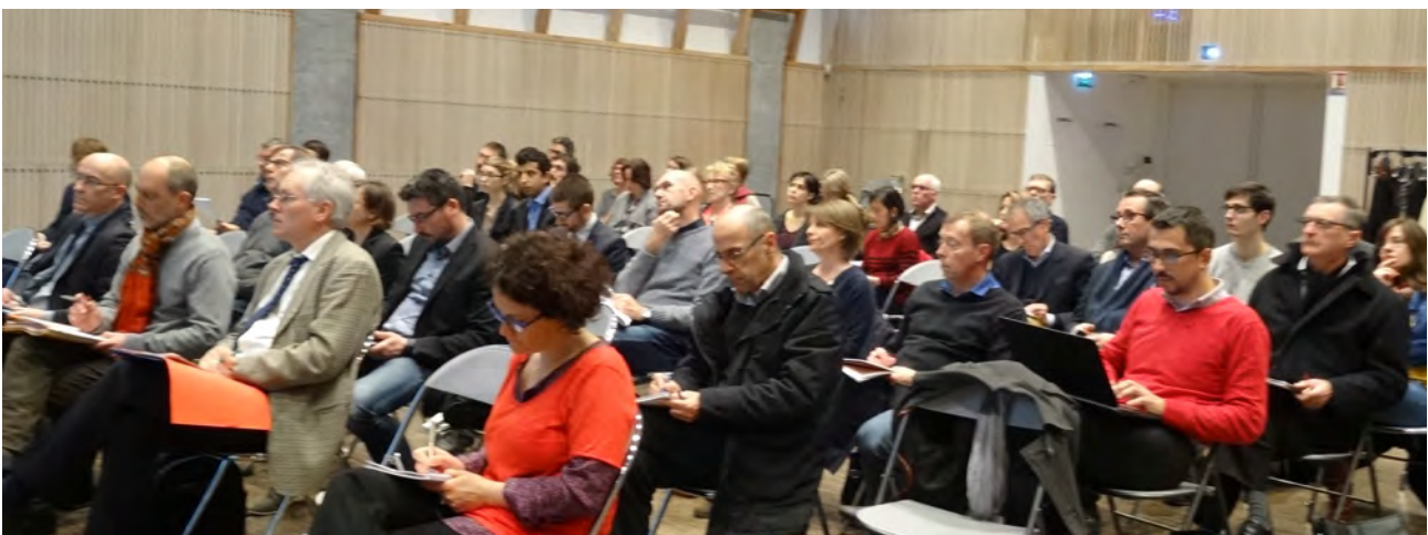
Ateliers ZA - Porter une réflexion sur l'implantation des activités économiques et la reconversion des friches - Mars 2016